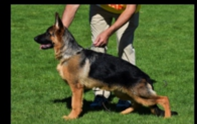
MP7. (Sieger) BAHIA COUTADA DO MONTE