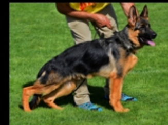
MP11. (Sieger) BRASIL COUTADA DO MONTE