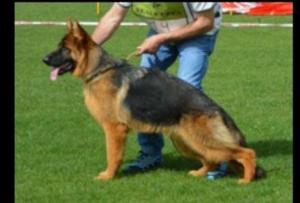
MP1. (Antequera) DAMA DE MARQUES DE VADO